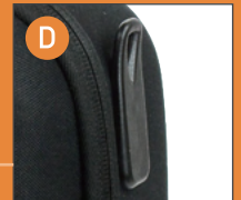
フック (対応品番のみ)