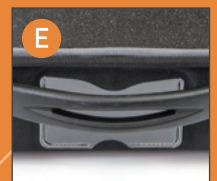
カードホルダー (対応品番のみ)