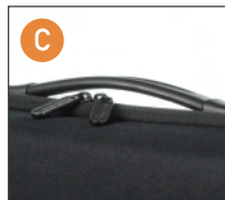
ハンドル (対応品番のみ)