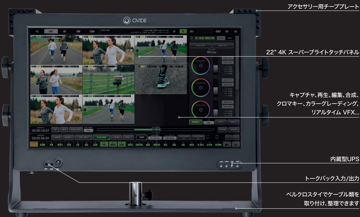
アクセサリ用チーププレート